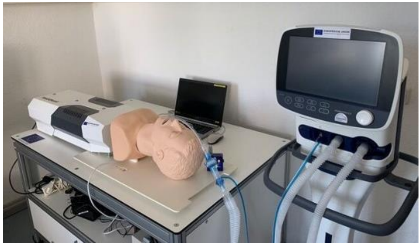
Lungensimulator mit Beatmung, Pulsoximetrie und CO2-Kontrolle