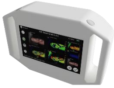
Hyperspektrale Kamera zur nicht-invasiven Diagnostik