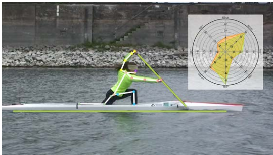
Computer-Vision für Sportanalysetechnologien

Biosignalverarbeitung © pixabay; Grafik Anika Schreyer HTWK Leipzig