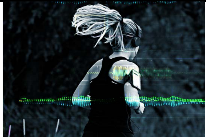
Pulsmessung bei starken Bewegungsstörungen

Biosignalverarbeitung Grafik Anika Schreyer HTWK Leipzig