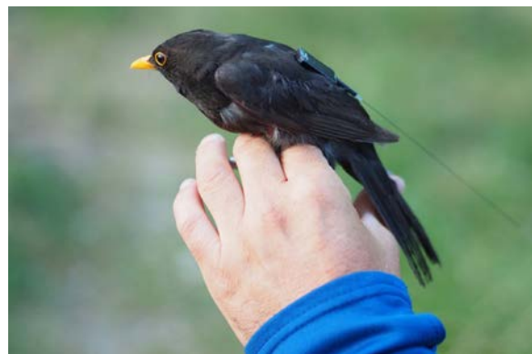
Vogelbeobachtung mittels der Internationalen Raumstation ISS

Grafik: MicroChip Signalverarbeitung © Anika Schreyer HTWK Leipzig, based on www.freepik.com